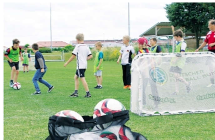
Training 2017 mit dem Bayerischen Fußballverband