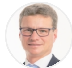
Bernd Sibler, MdL

Bernd Sibler, MdL Bayerischer Staatsminister für Unterricht und Kultus